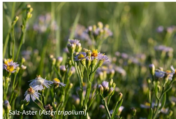
Salz-Aster ( Aster tripolium )

Die Teilnahme am Seminar ist kostenfrei. Die Anzahl der Teilnehmenden ist auf 30 begrenzt.