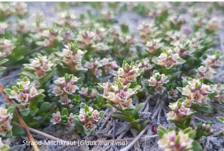
Strand-Milchkraut ( Glaux maritima )

Landesamt für Umwelt, Naturschutz und Geologie