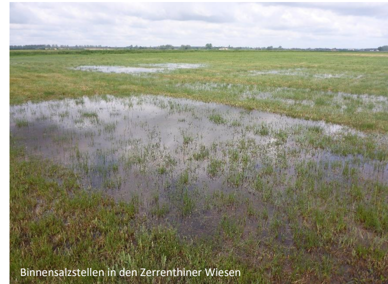
Binnensalzstellen in den Zerrenthiner Wiesen

24. September 2026 in Zerrenthin bei Pasewalk