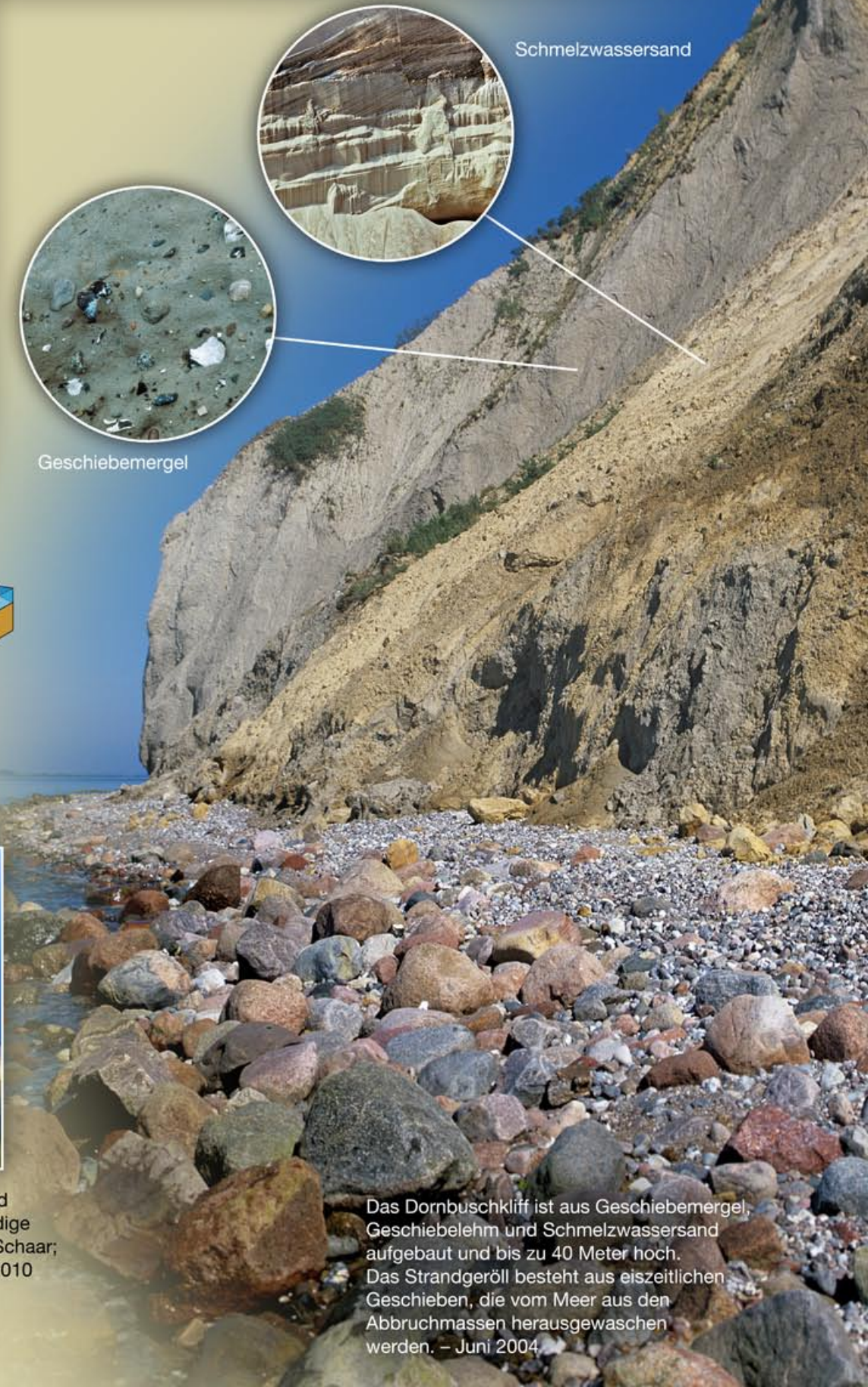
Das Dornbuschkloff ist aus Geschiebemergel, Geschiebelehm und Schmelzwassersand aufgebaut und bis zu 40 Meter hoch. Das Strandgeröll besteht aus eiszeitlichen Geschieben , die vom Meer aus den Abbruchmassen herausgewaschen werden. – Juni 2004