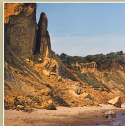
Abbruchmassen vor dem Steilufer am nördlichen Dornbuschkloff nahe dem Enddorn. Hier ist es für Strandwanderer besonders gefährlich. – September 1993