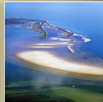
Die Sandhaken Alter Bessin (links) und Neuer Bessin (rechts); davor das sandige Flachwassergebiet der Bessinschen Schaar ; oben links der Dornbusch . – August 2010