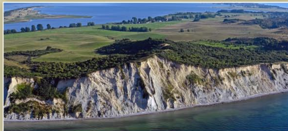
Das nördliche Dornbuschkloff mit dem Svantiberg – der am stärksten von der Abtragung betroffene Teil der Hiddenseer Steilküste. – August 2012