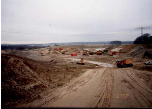
Kiessandgewinnung im aktiven Tagebau Zirkow im Jahr 1997