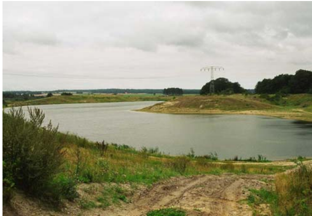
Der ehemalige Tagebau Zirkow zum Zeitpunkt der Vergabe des Rekultivierungspreises M-V im Jahr 2002.