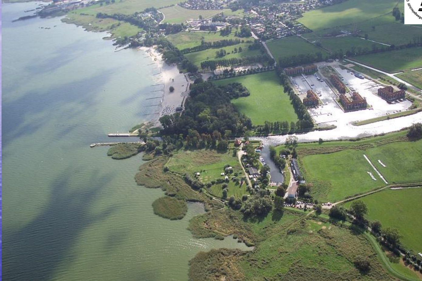
Das ZERUM: Bildungsstätte, Schullandheim, maritime Basis