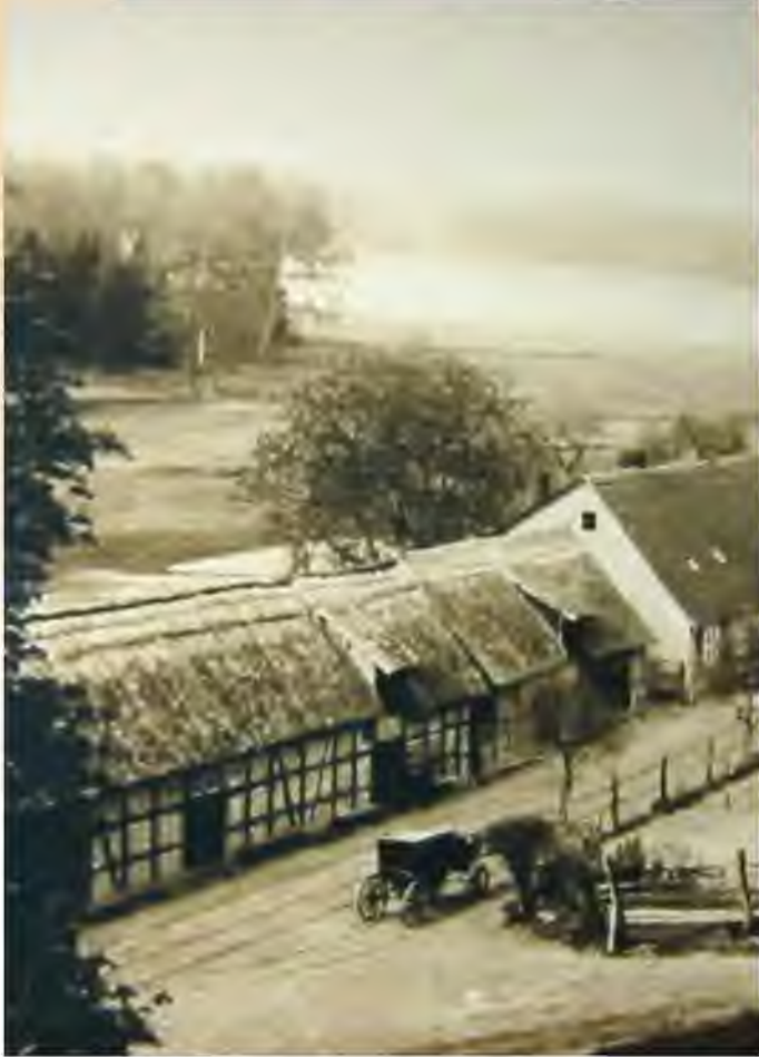
Altes Dorfbild Serrahn, 1920er Jahre, von Foto aus der ehemaligen Dauerausstellung