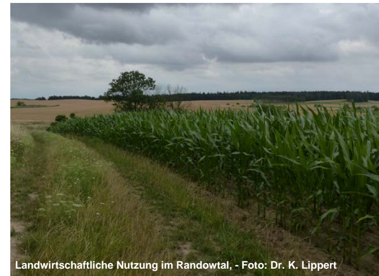
Landwirtschaftliche Nutzung im Randowtal