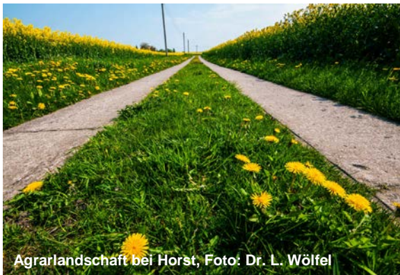
Agrarlandschaft bei Horst