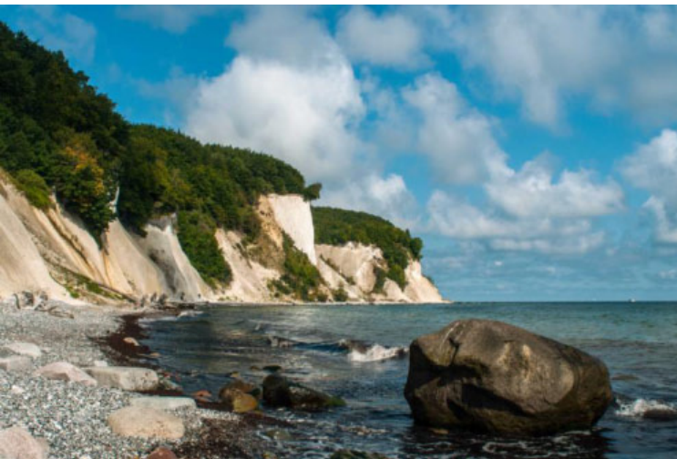
Stubbenkammer-Foto: Dr. Lothar Wölfel, 2018

Im Tagungsraum werden Ihnen heiße und kalte Getränke auf Selbstzahlerbasis angeboten.