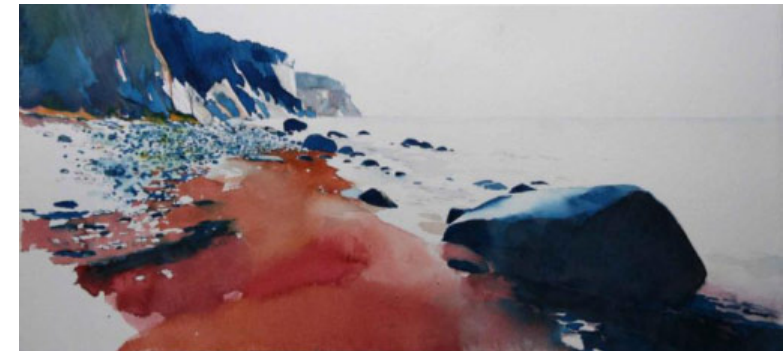
Kreideküste: Christoph Rosenow, Aquarell auf Bütten, 2006