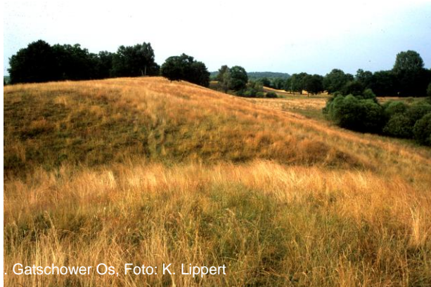
Gatschower Os, Foto: K. Lippert