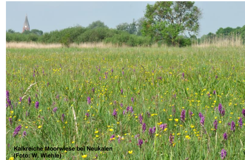
Kalkreiche Moorwiese bei Neukalen

Naturpark Mecklenburgische Schweiz und Kummerower See