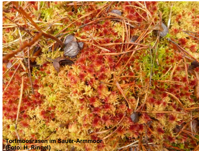
Torfmoosrasen im Sauer-Armmoor