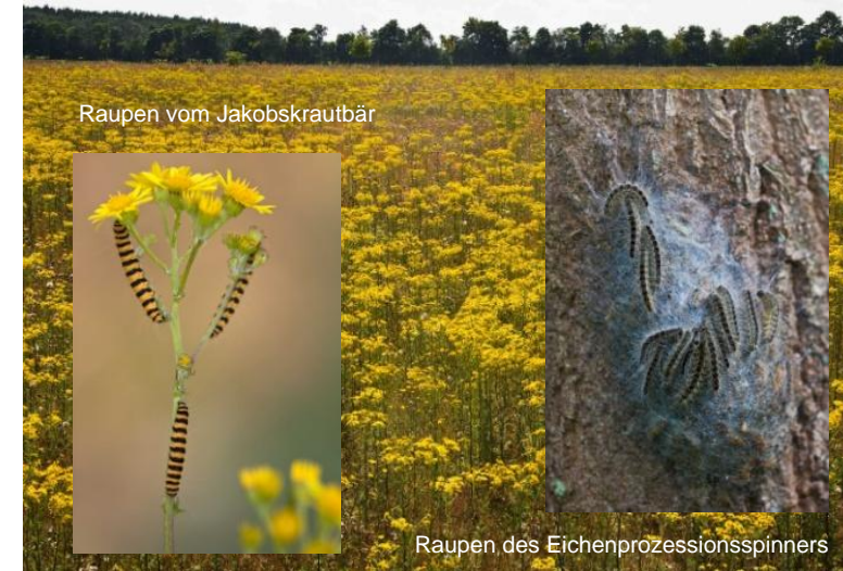
Raupen vom Jakobskrautbär