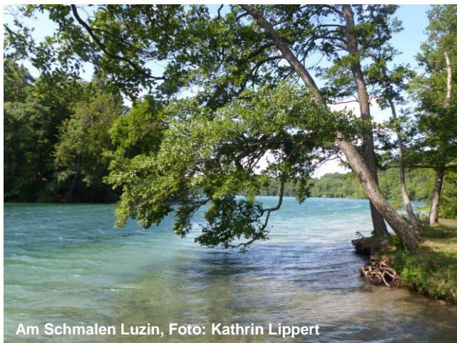
Am Schmalen Luzin

Zielgruppe: Alle Zertifizierten Natur- und Landschaftsführer*innen in Mecklenburg-Vorpommern Art: Seminar + Exkursion Termin: 31.03.2023 17:00 – 22:00 Uhr (und länger) 01.04.2023 08:00 - 22:00 Uhr (und länger) 02.04.2023 08:00 - 14:00 Uhr Ort der Unterkunft: Jugendwaldheim Steinmühle Steinmühle 2, 17237 Carpin Leitung: Frau Dr. Kathrin Lippert Landesamt für Umwelt, Naturschutz und Geologie M-V Mitarbeiter des Naturparkes Feldberger Seenlandschaft