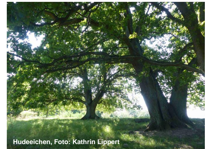
Hudeeichen, Foto: Kathrin Lippert

08:00 Uhr Gemeinsames Frühstück ca. 09:30 Uhr Exkursion per Elektroboot auf dem Schmalen Luzin Herr Frank Berg sowie Mitarbeiter des Naturparkes Feldberger Seenlandschaft 13:00 Uhr Mittagessen im Stieglitzenkrug in Feldberg ca. 14:00 Uhr Verabschiedung