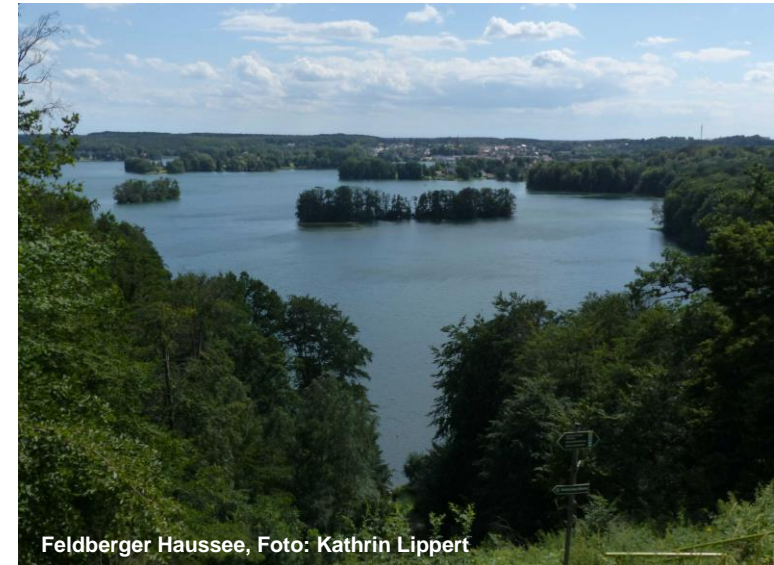
Feldberger Haussee, Foto: Kathrin Lippert

31.03. bis 02.04.2023 Naturpark Feldberger Seenlandschaft