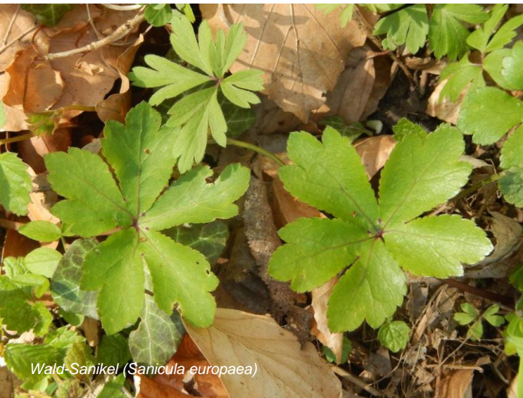
Wald-Sanikel ( Sanicula europaea )

Es wird eine Tagungspauschale von 30,00 EUR pro Teilnehmer erhoben. Diese ist vor Ort bar zu bezahlen.