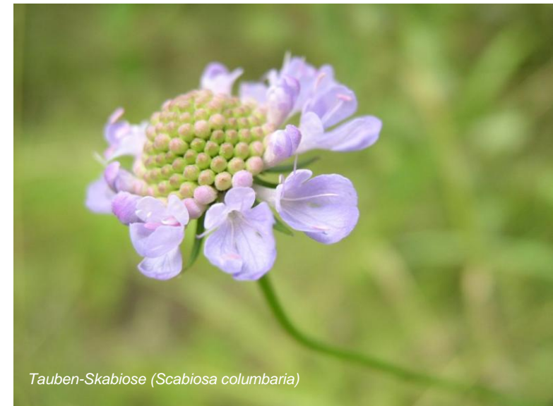
Tauben-Skabiose ( Scabiosa columbaria )