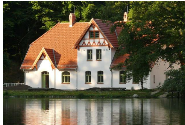
Jugendwaldheim Steinmühle

Auf der Seite www.muertitz-nationalpark.de/lernen-&-begreifen/Jugendwaldheim-Steinmuehle finden Sie die Informationen zum Seminarort und Hinweise zur Anreise.