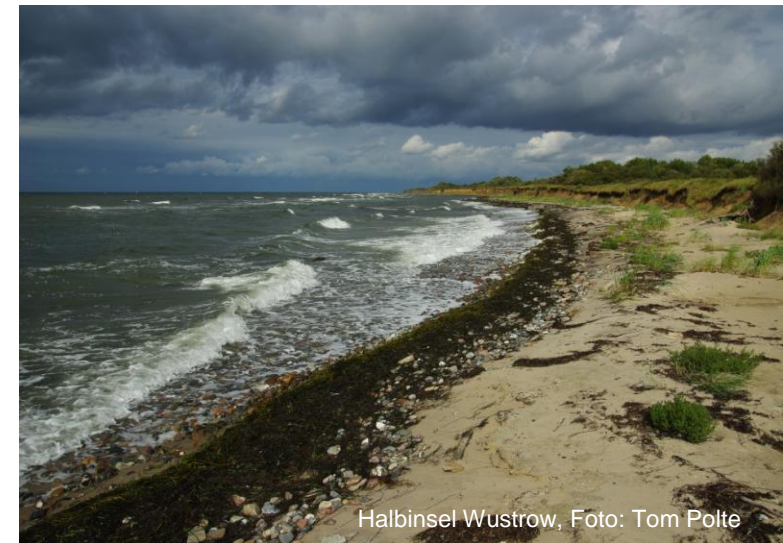
Halbinsel Wustrow

Landesamt für Umwelt, Naturschutz und Geologie Mecklenburg-Vorpommern Landeslehrstätte für Naturschutz und nachhaltige Entwicklung Goldberger Straße 12 18273 Güstrow Tel.: (0 38 43) 7 77-2 44