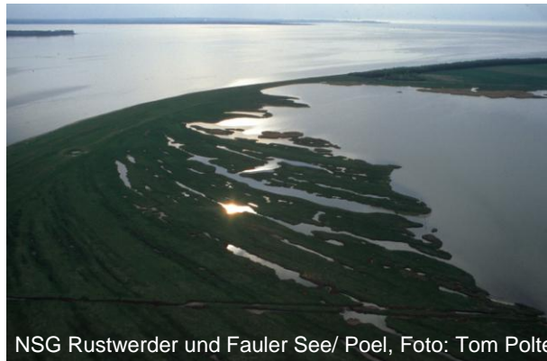
NSG Rustwerder und Fauler See/ Poel