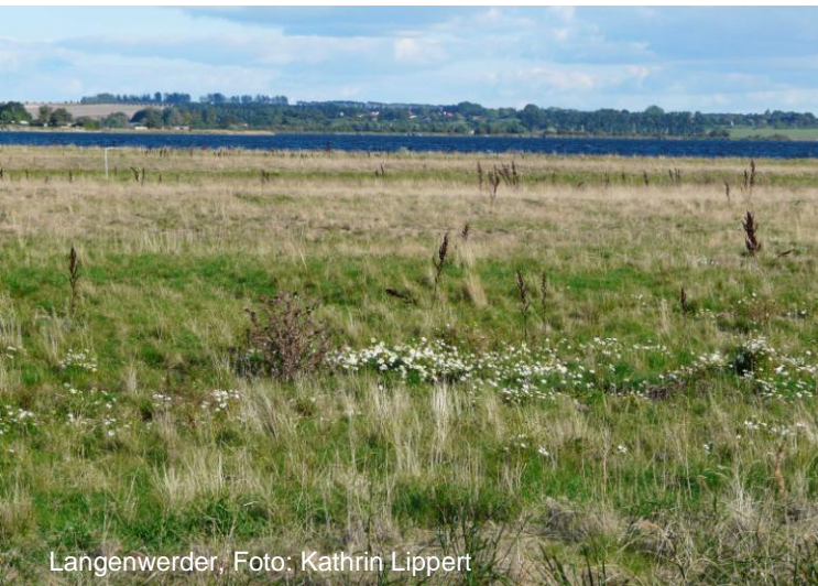
Langenwerder, Foto: Kathrin Lippert