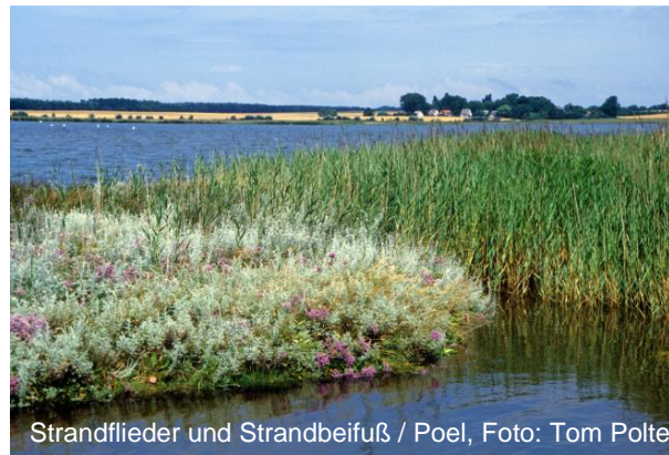
Strandflieder und Strandbeifuß / Poel, Foto: Tom Polte