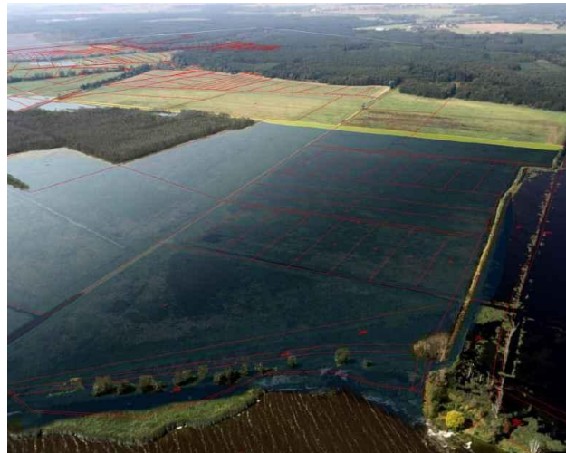
Fotosimulation – Darstellung mittleres Sommer-Hochwasser mit Deich im Polder Pinnow

Die Fahrten zwischen den Exkursionsorten werden mit eigenem KfZ zurückgelegt. Wir bitten um Bildung von Fahrgemeinschaften.