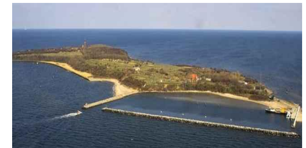
Luftaufnahme Insel Greifswalder Oie

ca. 16:00 Uhr Exkursionsende und Verabschiedung