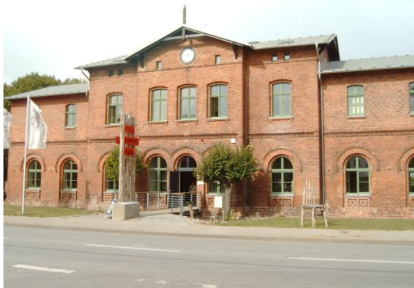
Klaus-Bahlsen-Haus Usedom – Sitz der Naturpark-Verwaltung