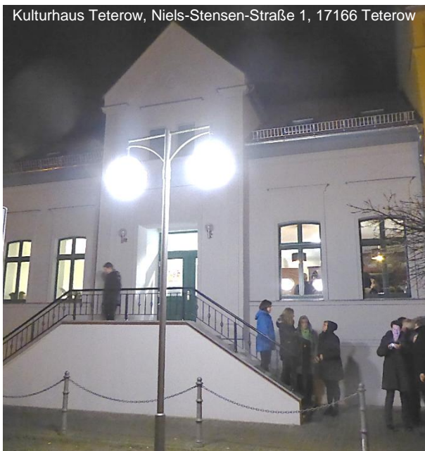
Kulturhaus Teterow, Niels-Stensen-Straße 1, 17166 Teterow

Bei Anreise per PKW diesen am besten auf dem Bahnhofsparkplatz abstellen und von dort zu Fuß (siehe Bahnreise) oder den Parkplatz am Platz des Friedens nutzen.